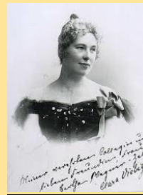
Clara Viebig *1860 +1952